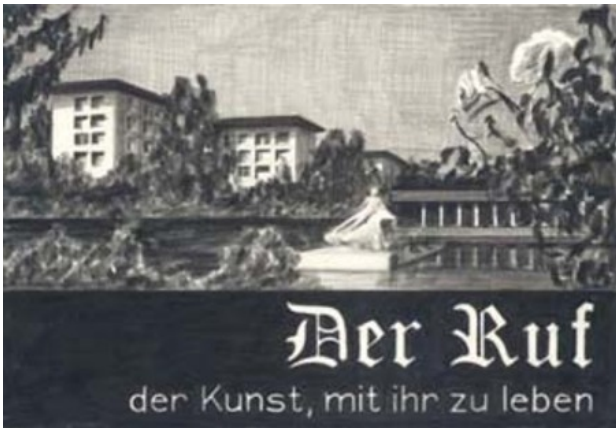
Zonder titel, 2004 Potlood, papier, 19 x 28 cm