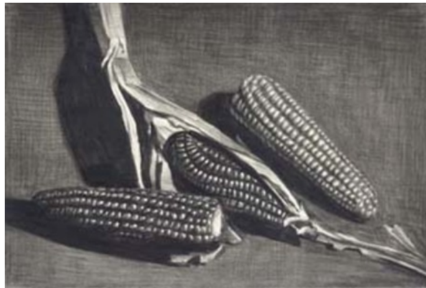
Zonder titel, 2005 Potlood, papier, 19 x 28 cm