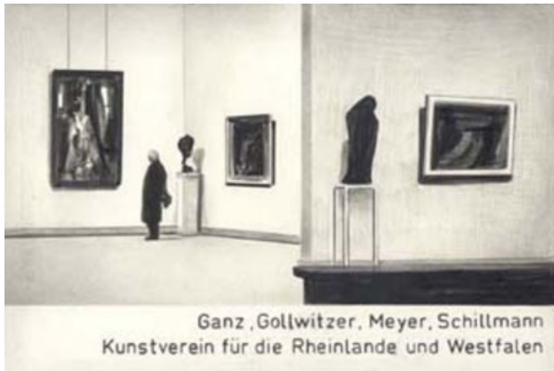
Zonder titel, 2005 Potlood, papier, 19 x 28 cm

2004 Städtische Galerie Delmenhorst, Delmenhorst (D) Zeignung vernetzt Group