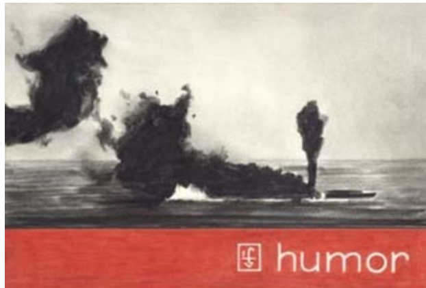
Zonder titel, 2004 Potlood, papier, 19 x 28 cm