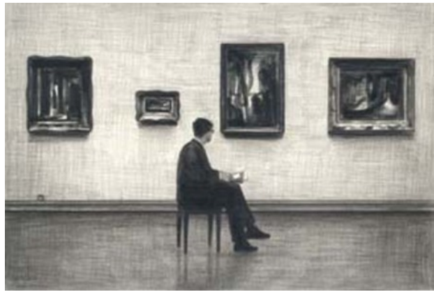
Zonder titel, 2004 Potlood, papier, 19 x 28 cm