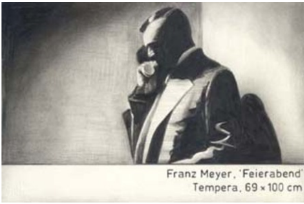
Franz Meyer, 'Feierabend' Tempera, 69 x 100 cm