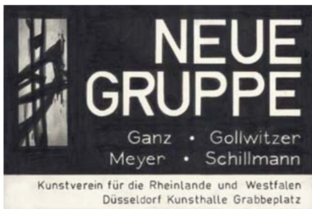
Zonder titel, 2005 Potlood, papier, 19 x 28 cm