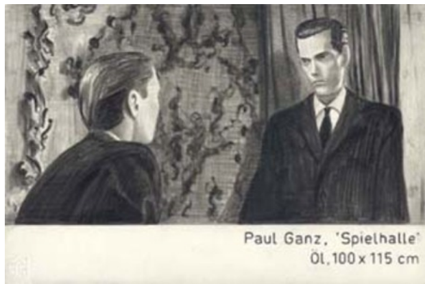
Zonder titel, 2005 Potlood, papier, 19 x 28 cm