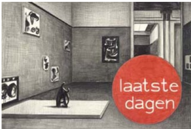
Zonder titel, 2005 Potlood, papier, 19 x 28 cm