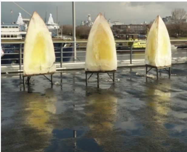
Gothische Vormen, 2015 IJs, 200 x 100 x 100