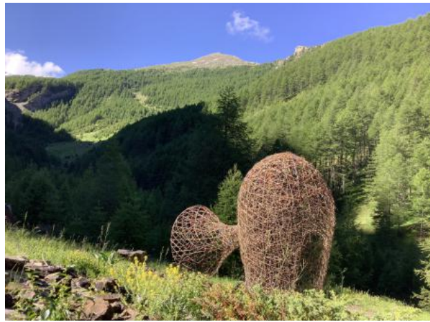
TADITADATADI - Akunzo, 2020 hazelaar, 300 x 150 x 300 cm