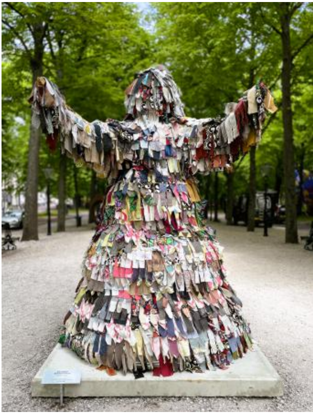
Big Mama welcomes you, 2025