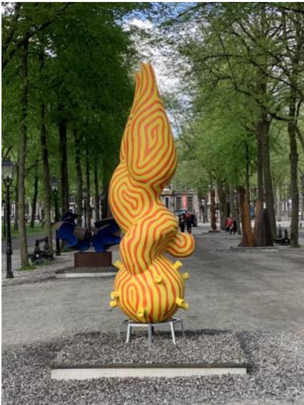
Challenge for Balance, 2021 Acrylaat, 300 cm hoog