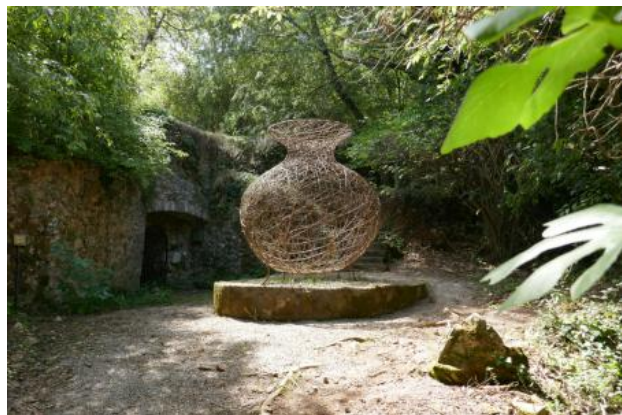
RESERVOIR - Akunzo, 2021

Beukentakken op metalen frame, 500 x 250 350 cm