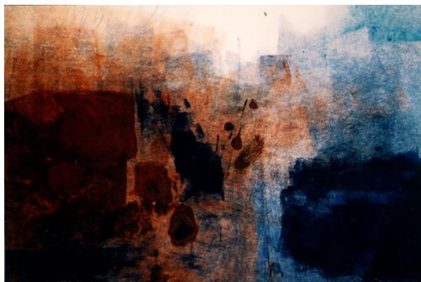
Antarctica, 1996 Monoprint, 50 x 60 cm