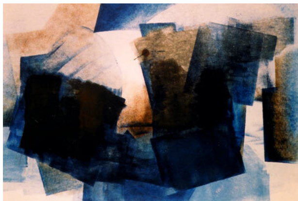
Antarctica, 1996 Monoprint, 50 x 60cm