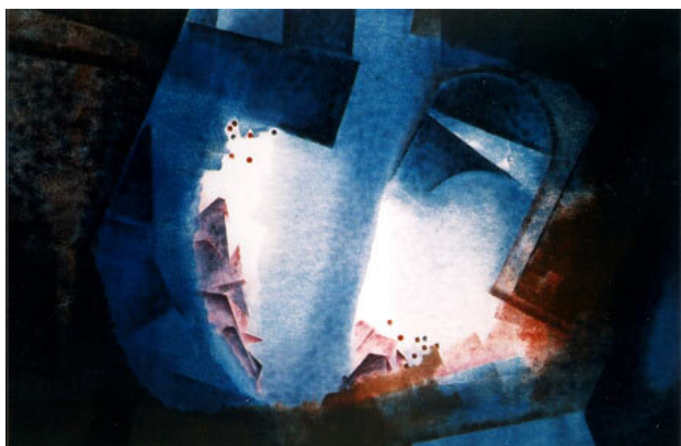
Antarctica, 1996 Monoprint, 50 x 60 cm