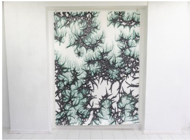
Rot, 2024 Graphite and colour pencil on paper, 2m x 1,50m