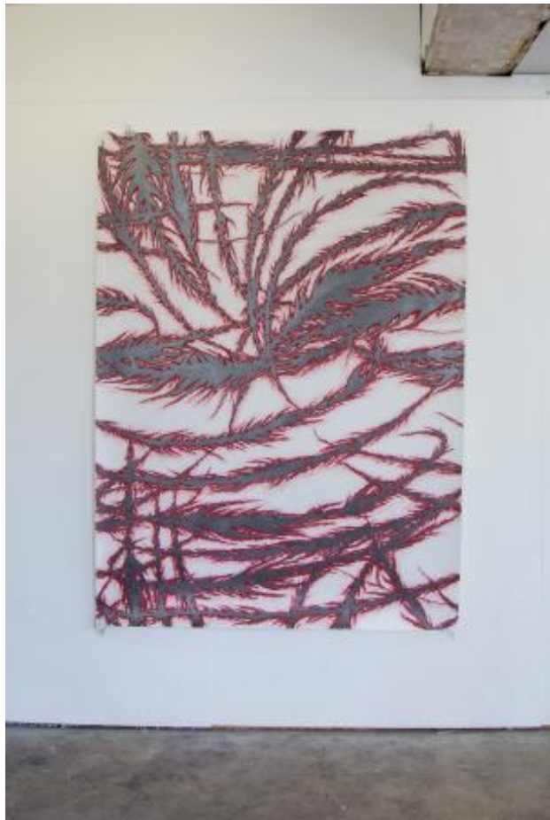
Carve I, 2023 Pencil and graphite on paper, 1,80m x 1,30m