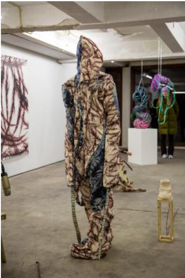
Dual Human, 2023 Silkscreen on textile, Variable