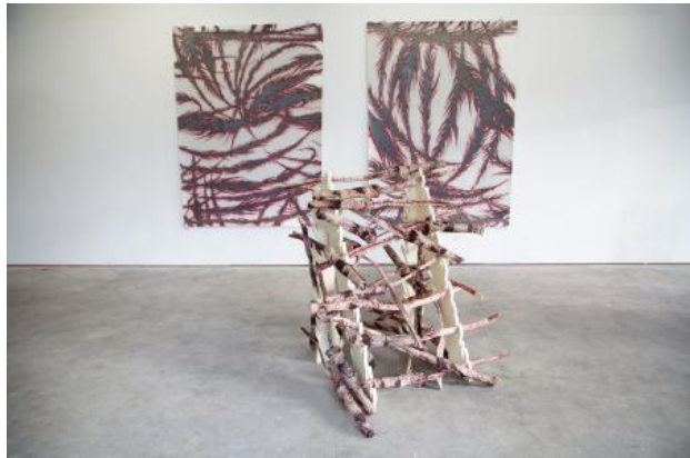
Katanas, 2023 Silkscreen on textile, wood and lacquer, Variable