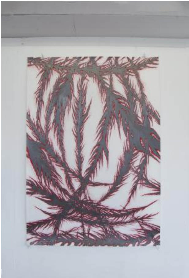
Carve II, 2023 Pencil and graphite on paper, 1,80m x 1,30m