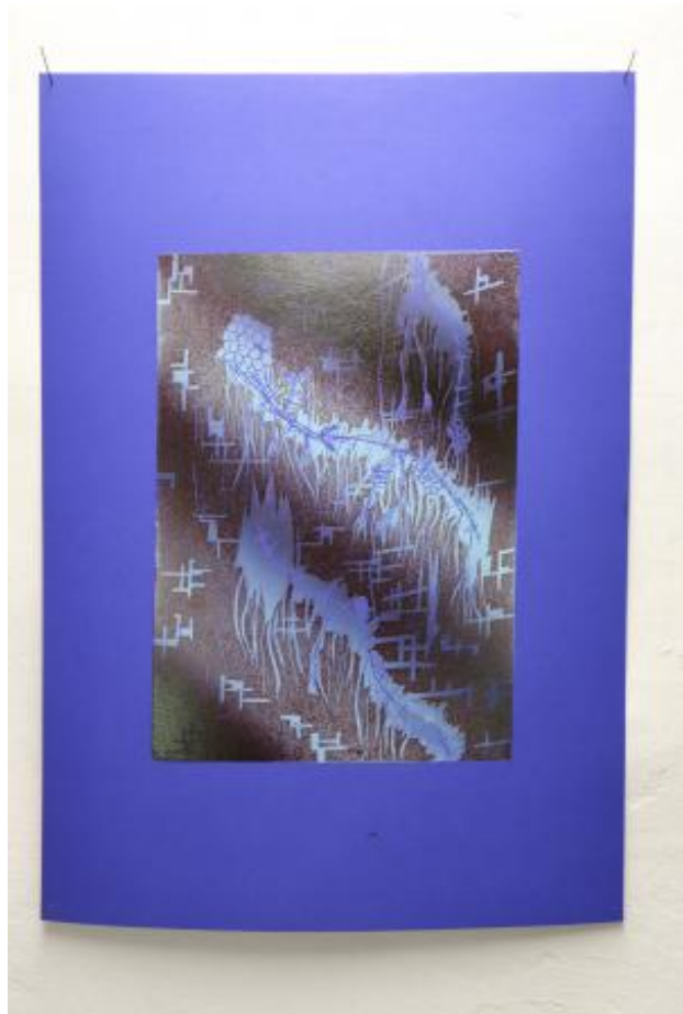
Symbiosis, 2023 Linoprint on paper, 42 cm x 29,7 cm