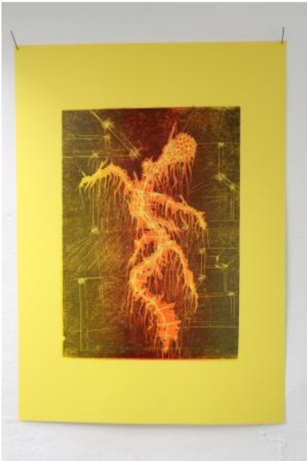
Sunborne, 2023 Linoprint on paper, 42 cm x 29,7 cm