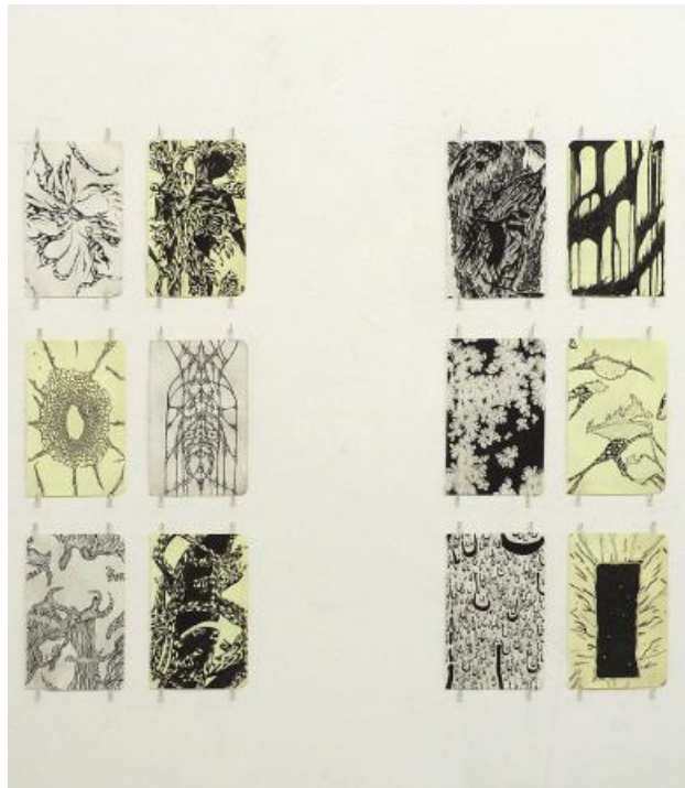
Wallpaper drawings, 2023 Fineliner and pencil on paper, 105 mm x 148 mm