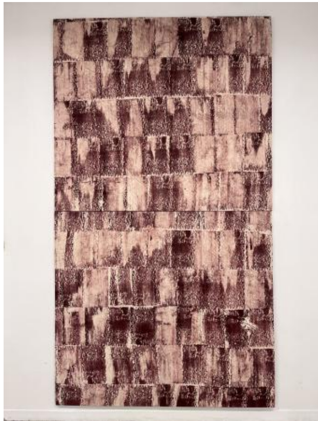
Vines, 2023 Silkscreen on textile, 3,30m x 1,65m