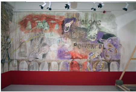
Bericht van de duif, 2024