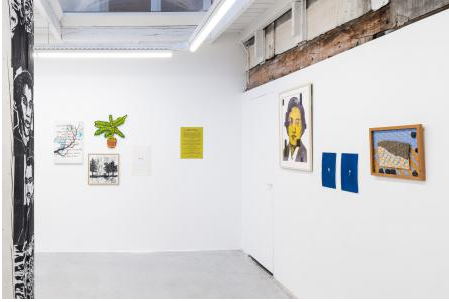
Manifest van het Meersortig Collectief, 2024