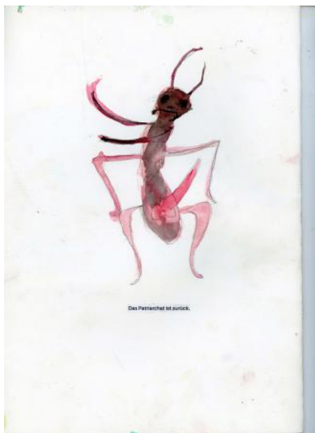
Das Patriarchat, 2025