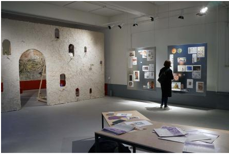
Bericht van de duif, 2024