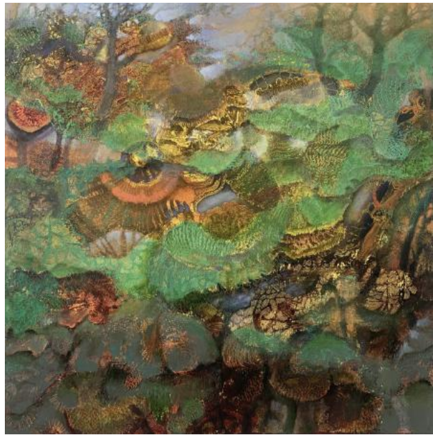
When autumn leaves me standing like a tree, 2023 olieverf, 100x100