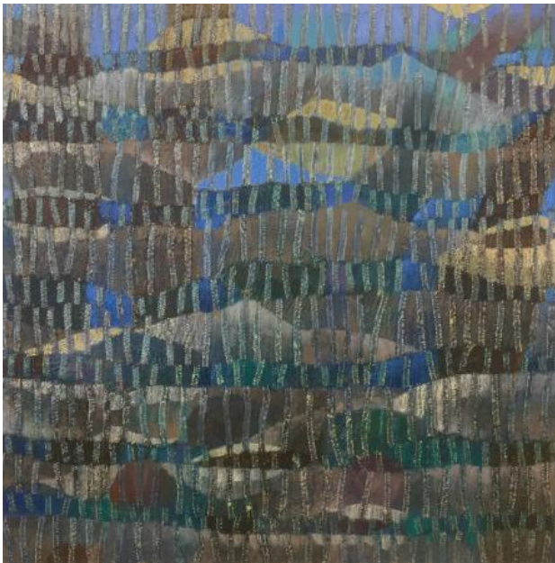
Under Water, 2021 Olie H2O, 100x100