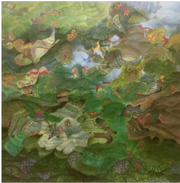
Post-human life, 2023 olieverf, 120x120