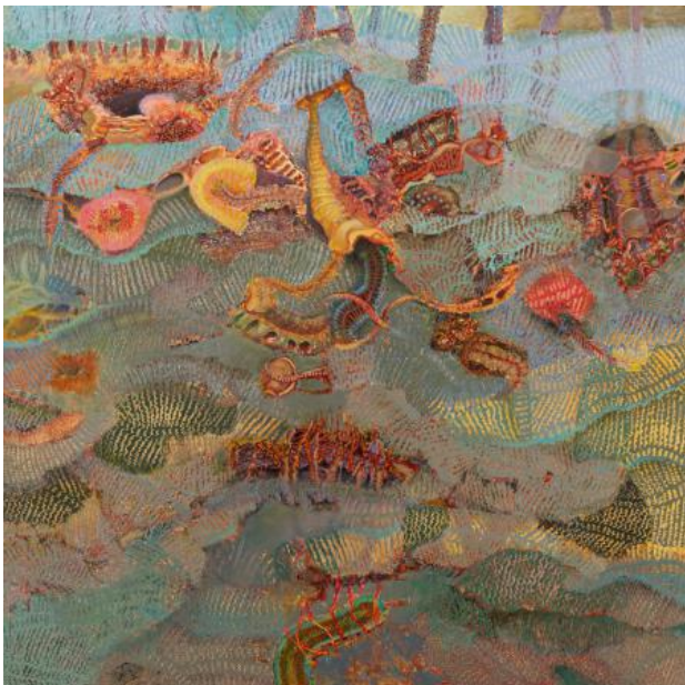
KAIROS: Underwater on a single breath, 2021 olieverf op linnen, 120x120