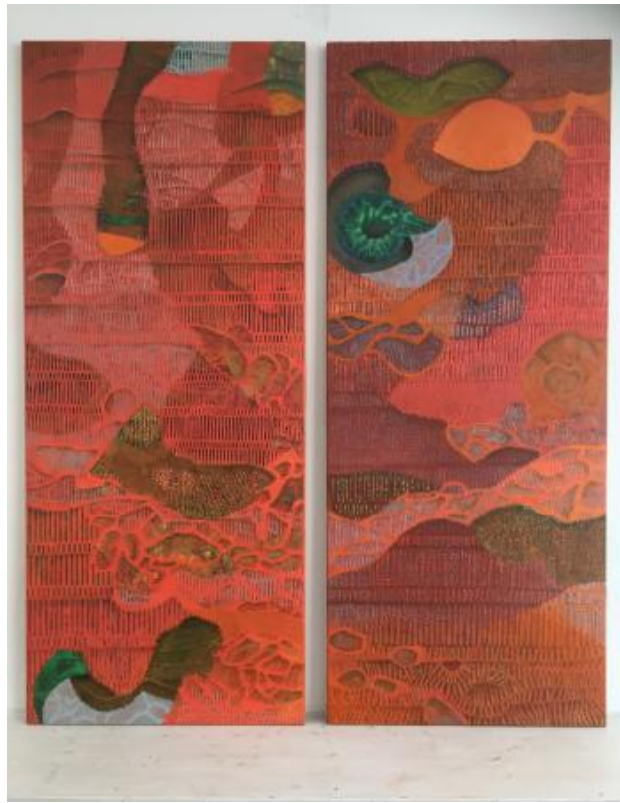
Charging Points (tweeluit), 2021 olie H2o, 170x70 (2x)