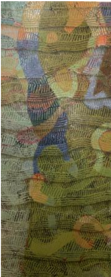
Stitched back to the front, 2023 olieverf, 70x170