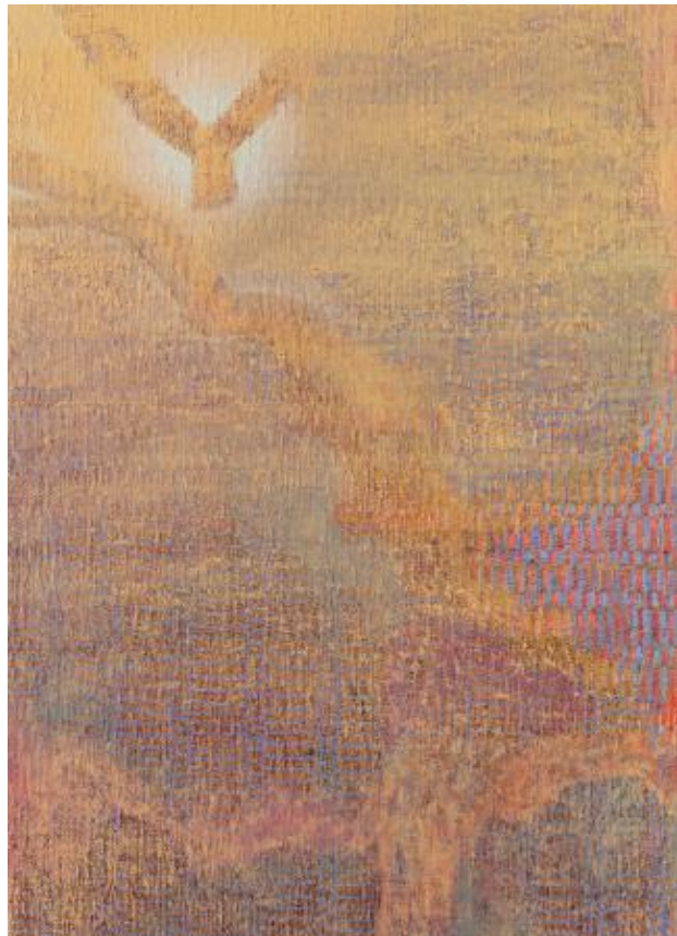
KAIROS: Loose end of the family tree, 2021