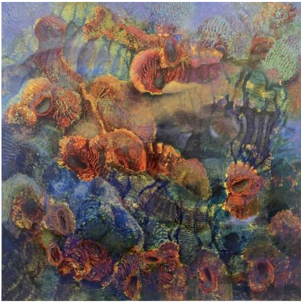
Water Ballet, 2023 olieverf, 100x100