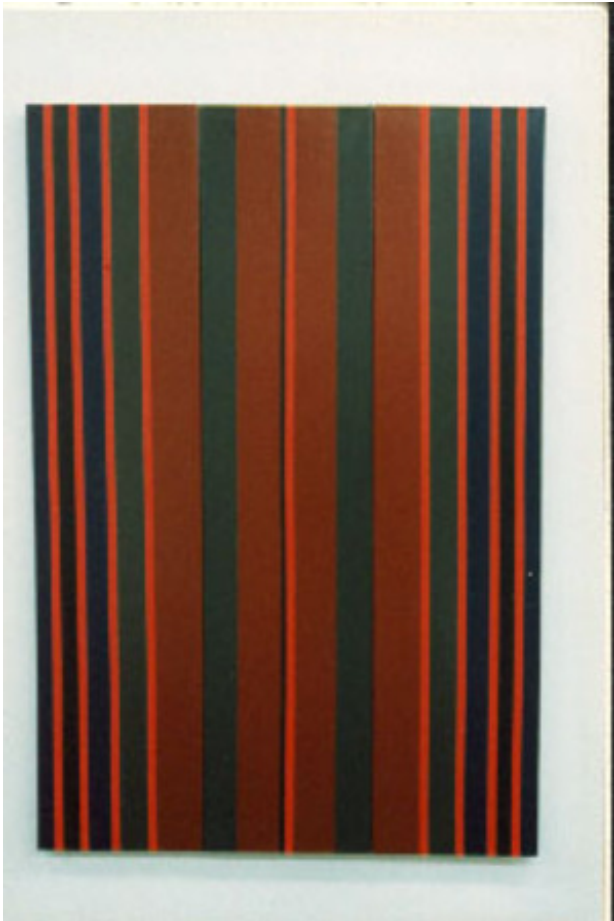
zt, 1997 acryl op katoen, 90-150 cm