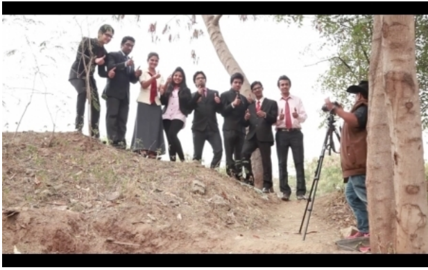
B(usiness) as U(sual), 2014 video