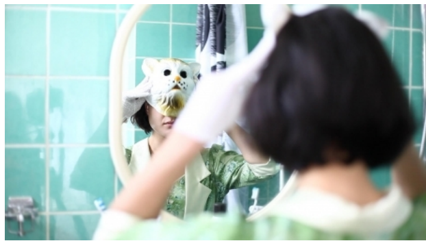
Sometimes I wish I were a cat, 2013 video