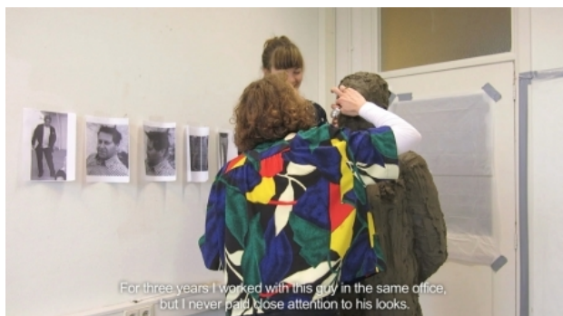
Johan, 2015 Klei, video