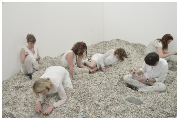
Got my mind on confetti and confetti on, 2015 performance