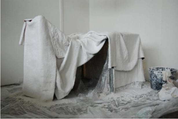
Hütte, 2012 mixed media, gips

KABK Eindexamen expositie, 2012 installatie