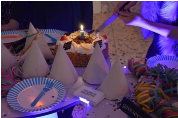
Party Hats /Hoedjes / Chapeaux / Hütche, 2014 gips