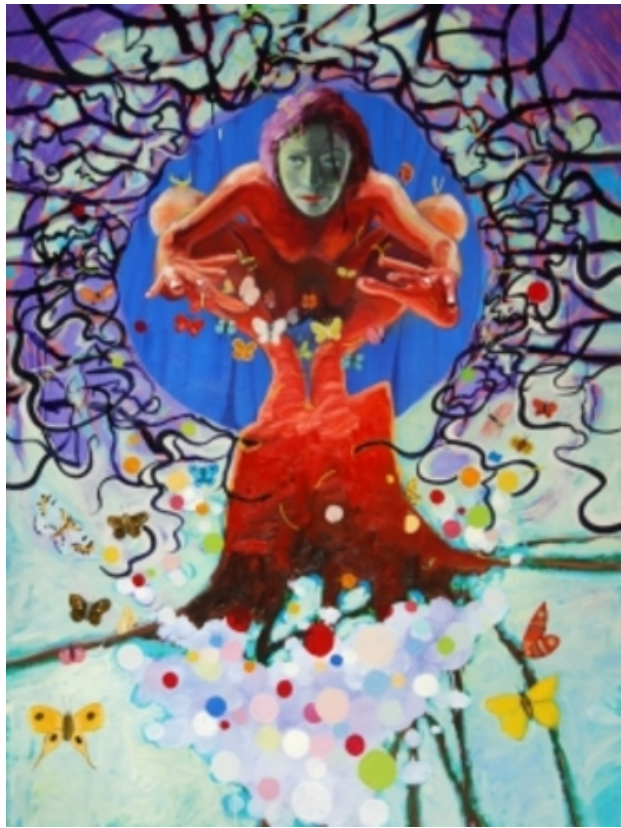
het vlindermeisje, 2010 olieverf op linnen, 160 x 120