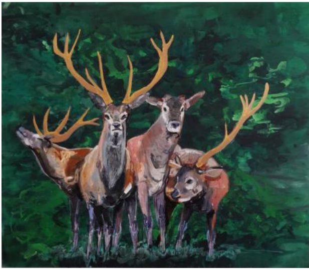
dain,dvalin,duney en durathor, 2025 olieverf, acrylverf, acrylinkt op canvas, 200 x 160