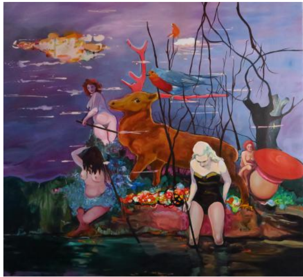
the fellow travellers, 2021 olieverf en acrylverf op canvas, 200 cm x 190 cm