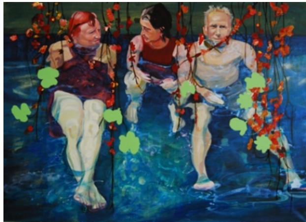
het gesprek, 2015 olieverf op linnen, 190 x 130