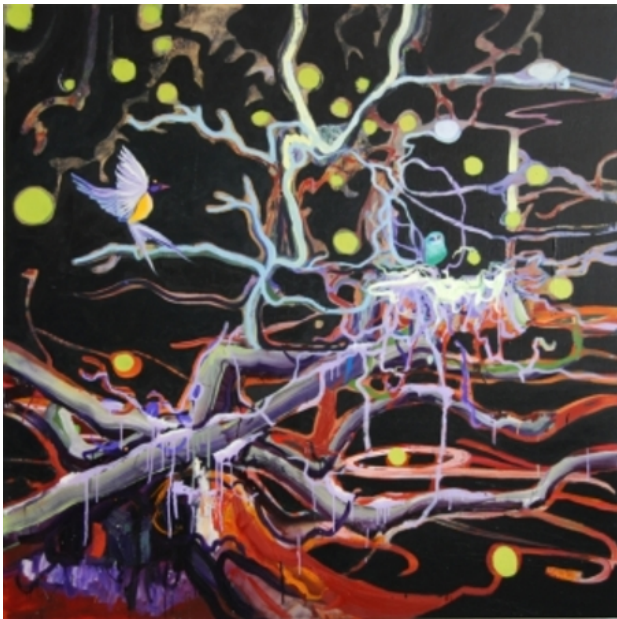
aanvliëgend in het donker, 2010 olieverf op linnen, 140 x 140