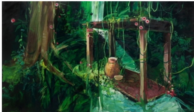
vuurvliegen en de zielen van de Iban in, 2009 olieverf op linnen, 320 x 160