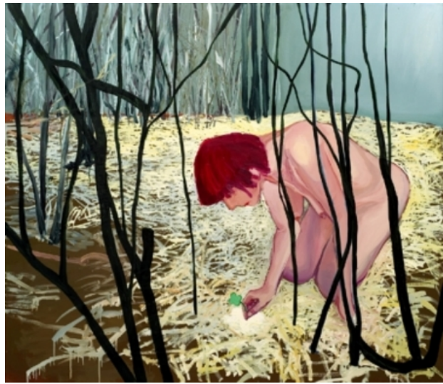
het sprookje van het geluksmeisje en het, 2007 olieverf op linnen, 150 cm x 130 cm