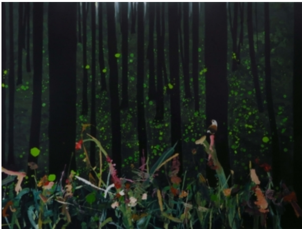
nychthemeron 13 the deeper I go the dark, 2018 olieverf op linnen, 160 x 120