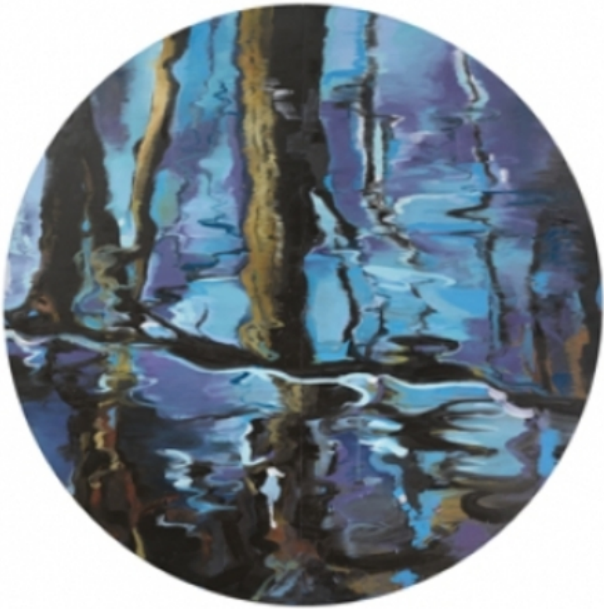
de beek, 2007 olieverf op linnen, 240 x 240