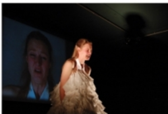
Waterschade of de drielingzenuw 2010, Niske Koek

'Waterschade of de drielingzenuw', 2010 performance