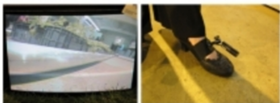
'Doorlopend', De luis der lusten 2008, Niske Koek

'STAP', 2009 video installatie/ omgeving