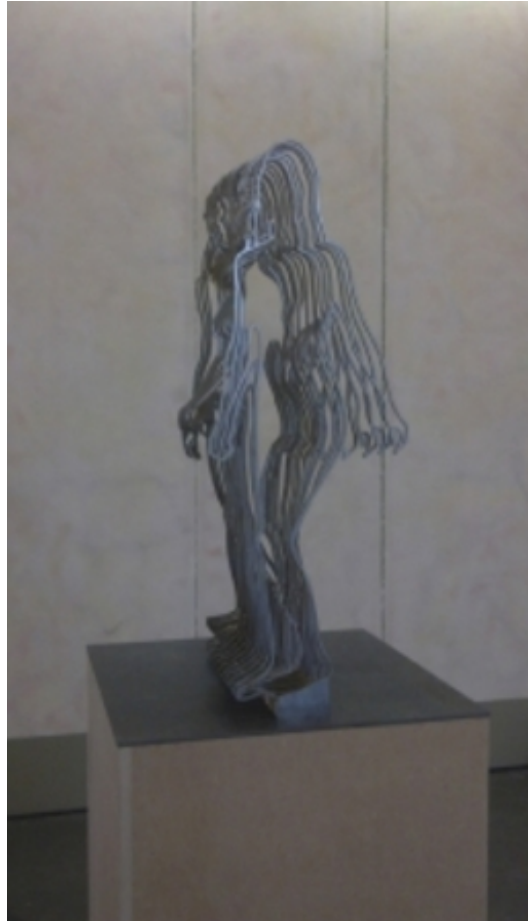
'1 seconde #1', 2011 sculptuur, staal, mdf, 180