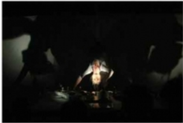
Hysterie, 2008, Niika Koski

'Hysterie, arc de cercle', 2008 performance