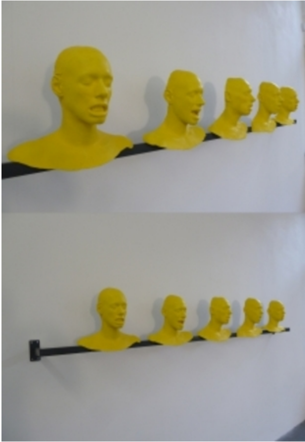
Yellow, 2012 life-casting, gips, epoxy, 300