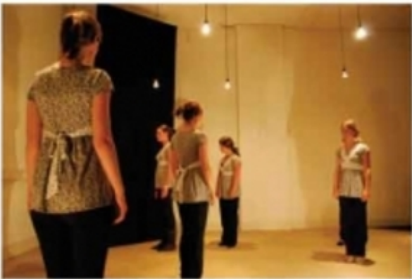
Ornamenten, 2007, Niika Koski