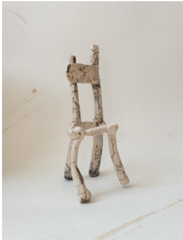
RakuChair, 2024 Raku, 20 x 8 x 7 cm