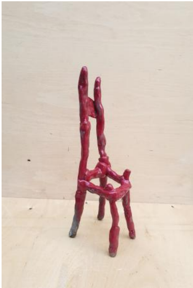
Raku Chair, 2022 Keramiek, 34 x 13 x 11 cm