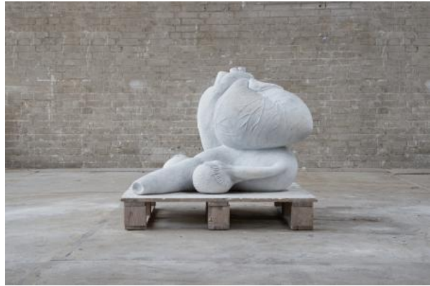
Living Spaces, 2018 Stone carving, 61 x 90 x 56 cm