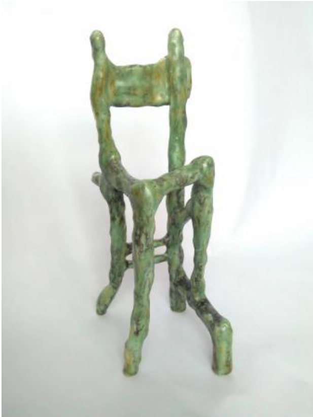
Chair 23, 2019 Stoneware with unique glaze, 40 x 20 x 14 cm