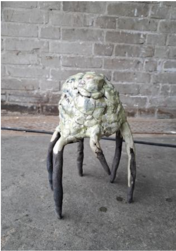
Monstrosis, 2025 Raku unique glaze, 27 x 20 x 20 cm