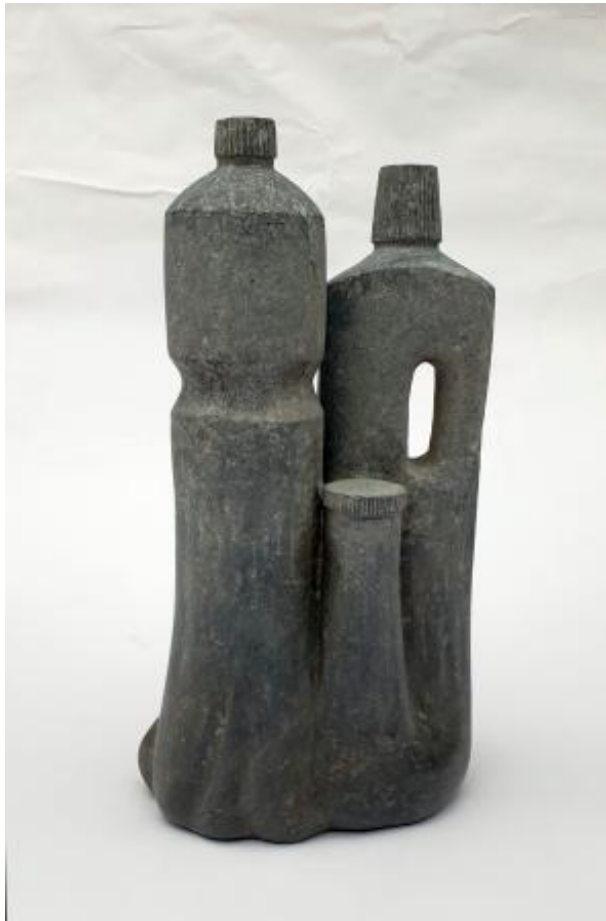
Plasticeen, 2020 Stone carving, 42 x 15 x 21 cm