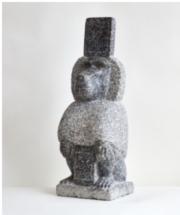
iToht, 2016 Stone carving, 60 x 21,5 x 18 cm