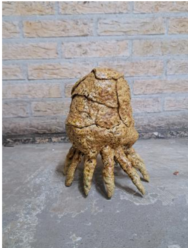
Monstrosis, 2025 Stoneware unique glaze, 25 x 15 x 15 cm