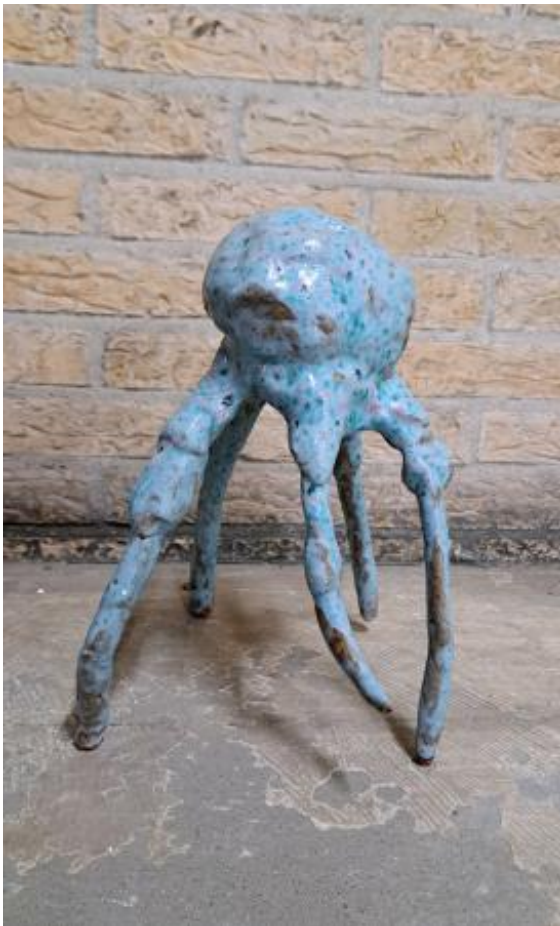
Monstrosis, 2023 Stoneware unique glaze, 31 x 27 x 24 cm