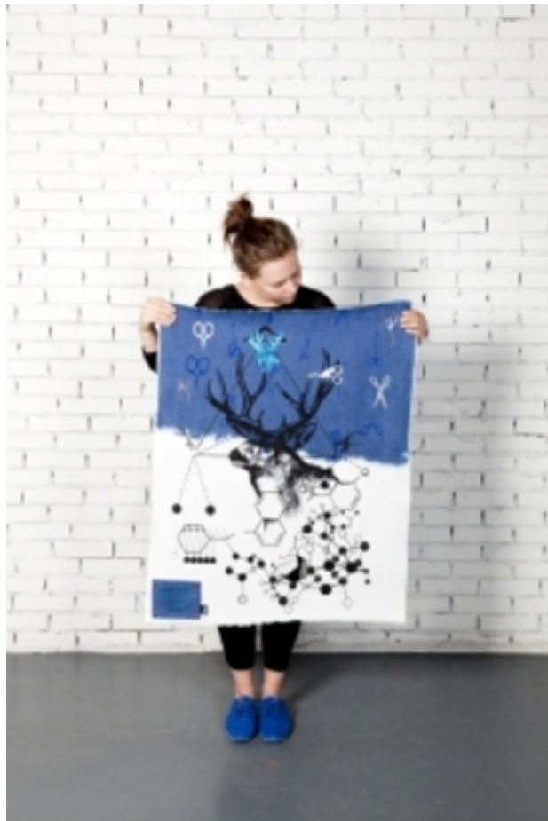
Denim days / sleepless nights, 2014 zeefdruk op textiel, 100 cm x 120 cm