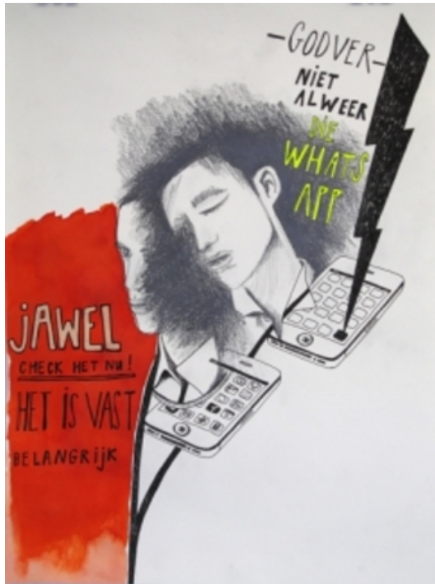
Generation Overload; WhatsApp, 2012 ecoline, marker, fineliner, potlood, 29,7 x 21