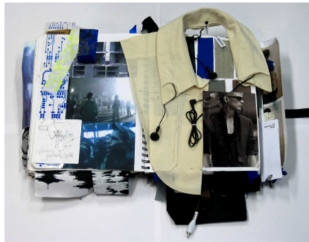
Codex Memoria schetsboek 'Film', 2008 collage technieken, boek: 29,7 x 21 Film: 1:55 minuten