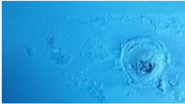
Underneath, 2016 Acryl op doek, 40 x 50