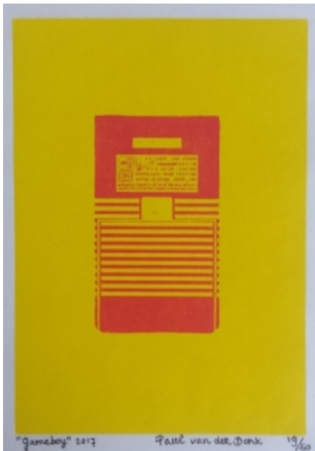
Gameboy 2017 nr 20 / 50, 2017 Grafiek, 28 x 35