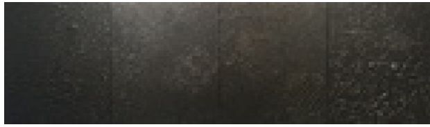
Wasted, 2016 Acryl op doek, 220 x 50 cm