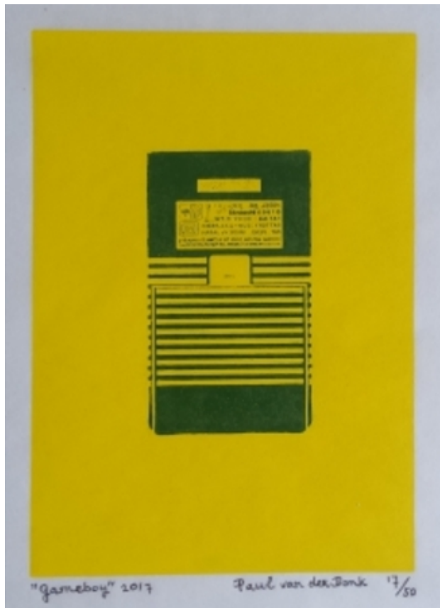
Gameboy 2017 nr 17 / 50, 2017 Grafiek, 28 x 35