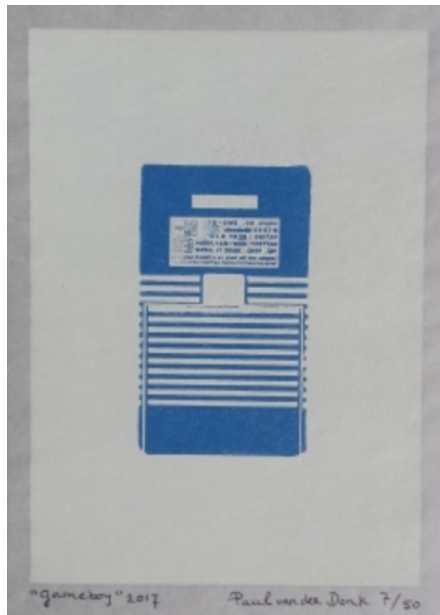
Gameboy 2017 nr 7 / 50, 2017 Grafiek, 28 x 35