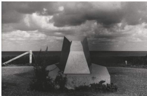
Hemels gewelf James Turrell, 2015 Fotografie, 17.5 x 24 cm