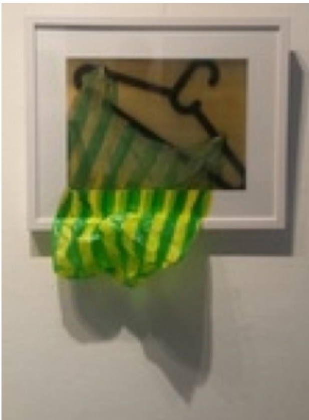
collage, 2017 collage, 40 x 55