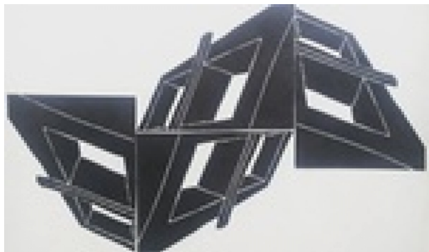
Grafieksch, 2005 Linosnede, 35 x 65