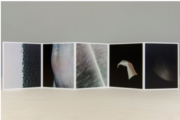
Still, 2014 Offset