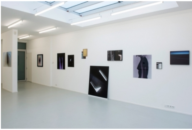
Time Image, 2014 c-prints