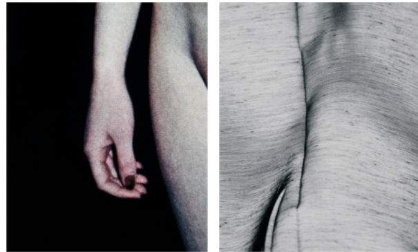
He who wants fire..., 2013 inkjet prints