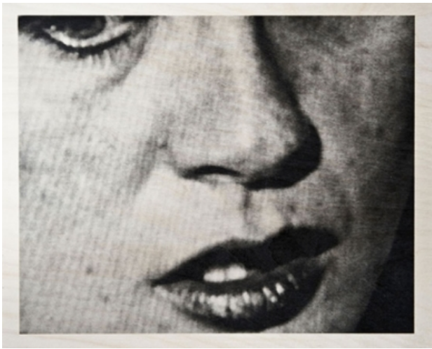
Two Too, 2011 zeefdruk op hout