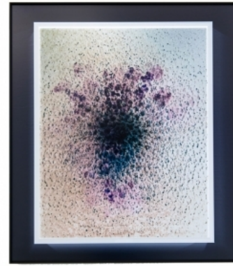
Au fond, 2014 c-print