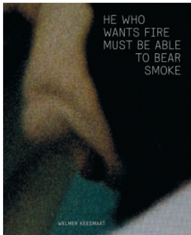
He who wants fire..., 2013 Offset, 18x23