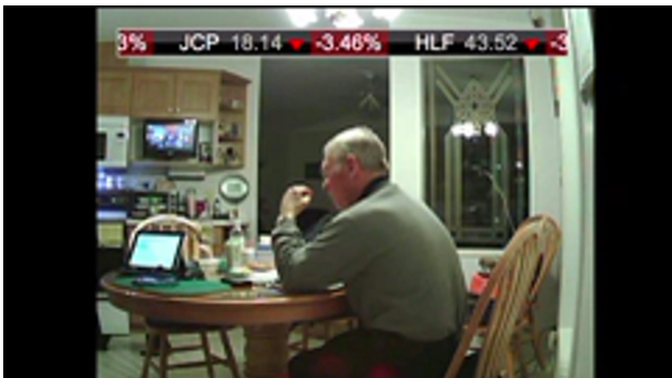
Screening Reality / Streaming Reality, 2013