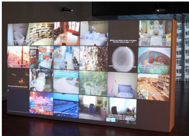
Streaming Reality, 2013 live projecties