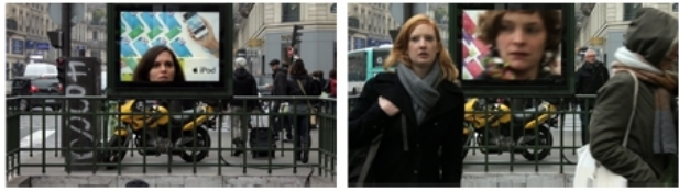
Screening Reality / Metro, 2013 video