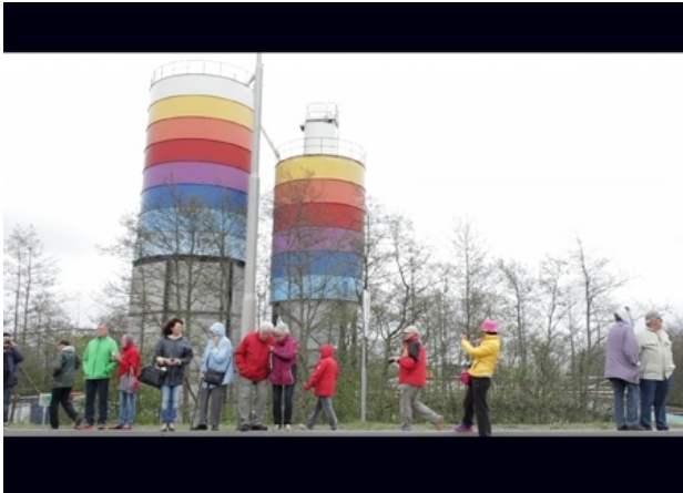
Here we are now #1, 2016 video