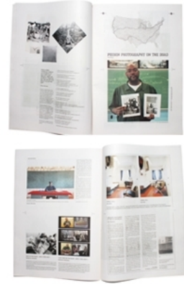
Cruel and Unusual, 2012