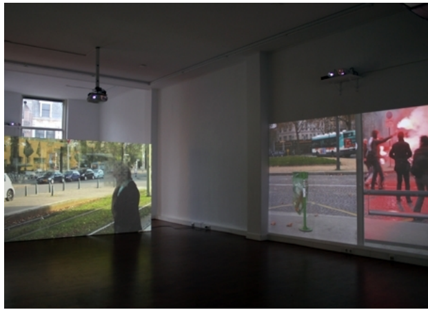
Screening Reality, 2013 projecties