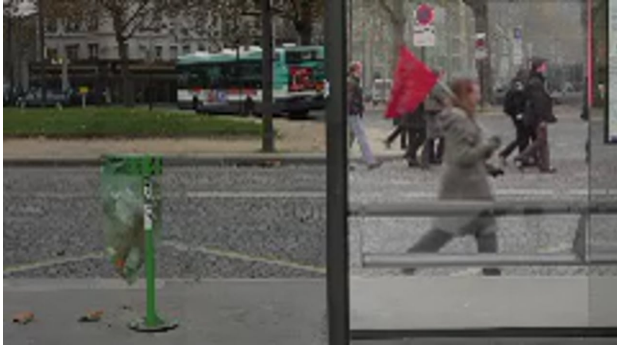
Screening Reality / Protest, 2013