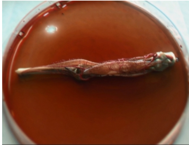
UK Music Video Award, 2015 Animatie, 2013