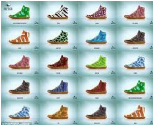
Rayfish Footwear, 2021 2020