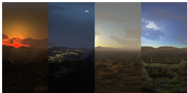
DUST, 2021 2019, www.seriousfilm.nl