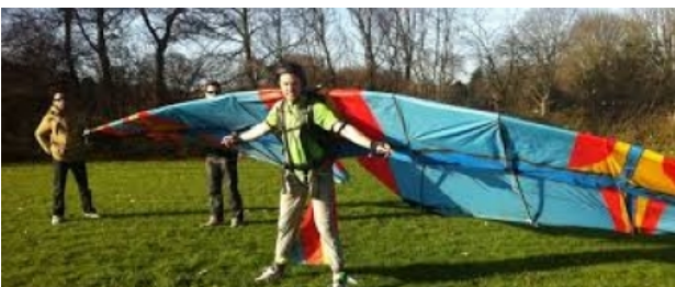
Human Birdwings, 2012 Online, 2014