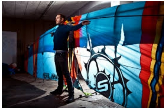
Human Birdwings, 2012 Online, 2014