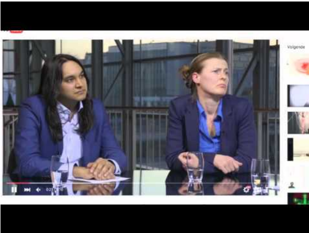
The Modular Body, 2015 1:00