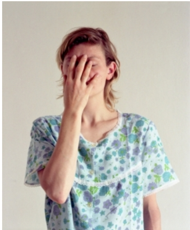
Insight No.3, 2009 C-41, op aluminium in lijst, 39.5 x 46 cm