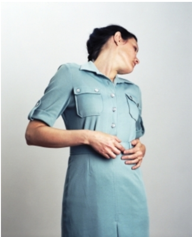
Woman in blue dress, 2007 C-41, dibond & geplexificeerd, 85 x 86 cm