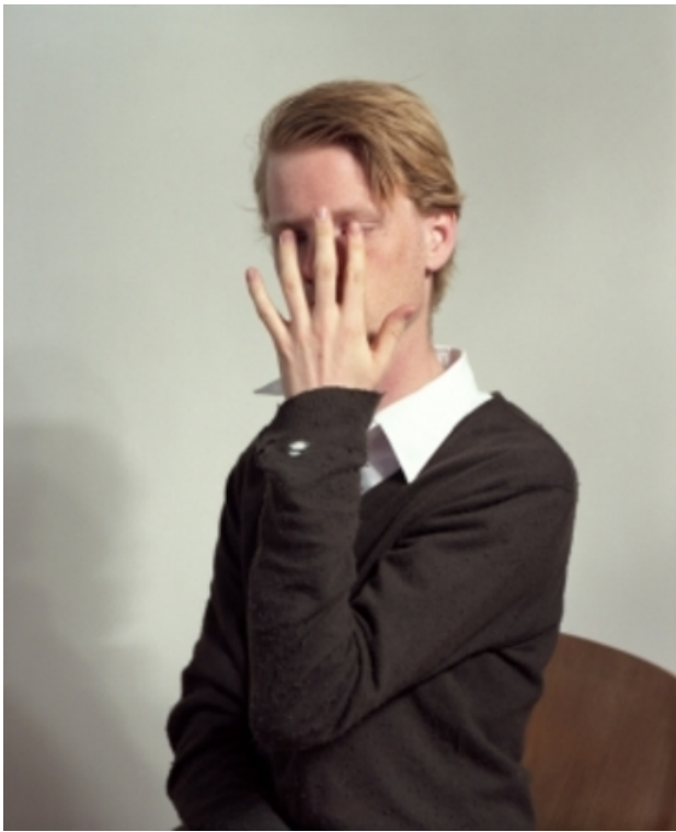
Insight No.1, 2009 C-41, op aluminium in lijst, 39.5 x 46 cm