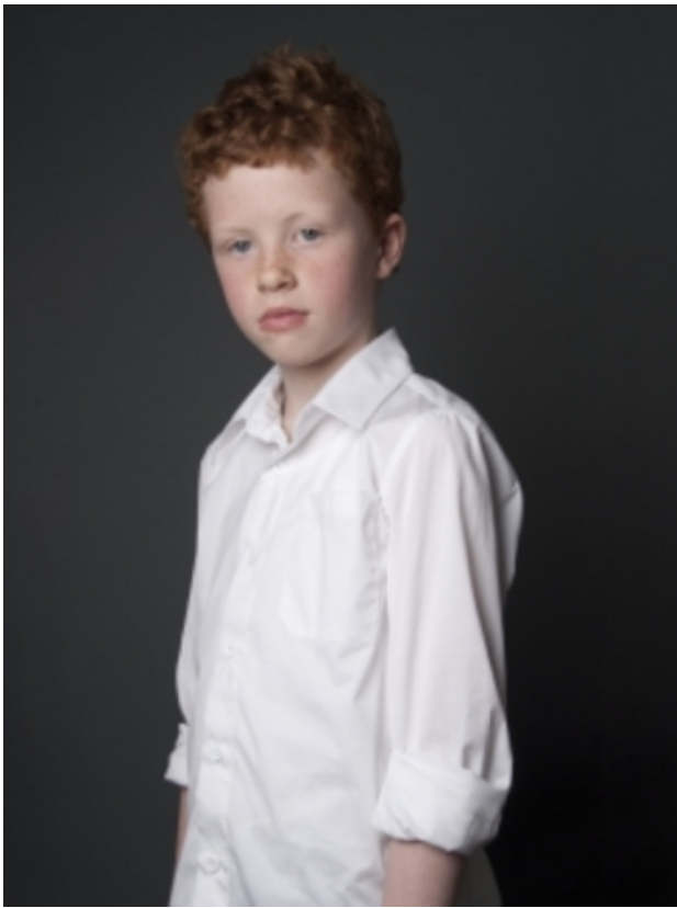
Kids with character, Hein, 2013 Fotografie, 30 x 40