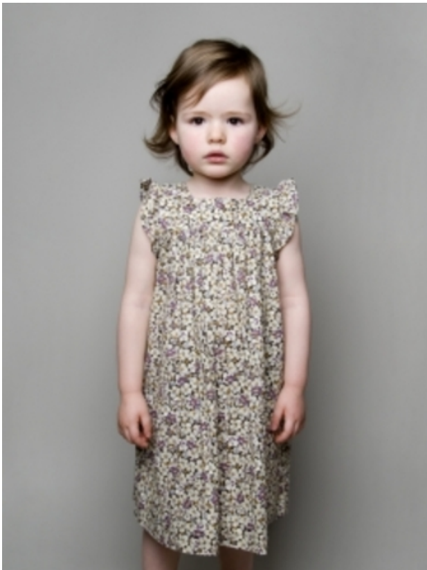
Kids with character, Evi, 2013 Fotografie, 30 x 40