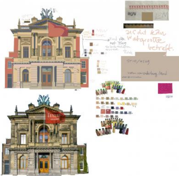
het Teylers, 2022 digitaal