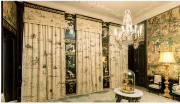
nieuwe gordijnen en situ, 2023