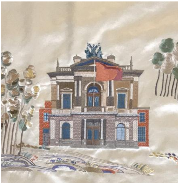
Het Teylers, 2022 machinaalgeborduurd zijde, 40x40cm