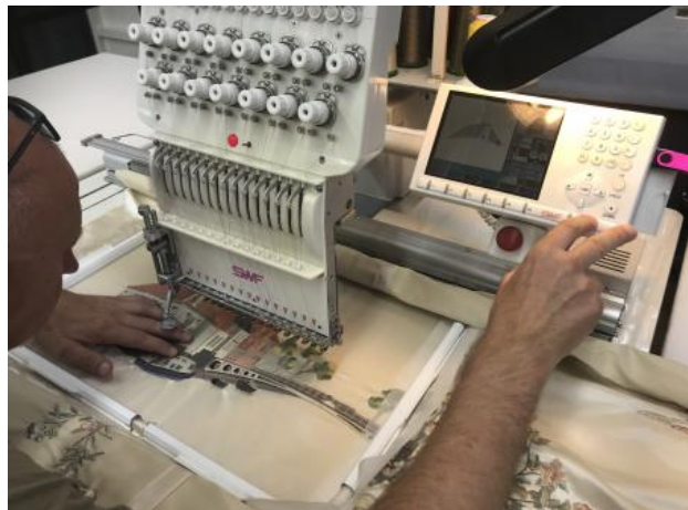
Dokkum, 2022 machinaal borduur