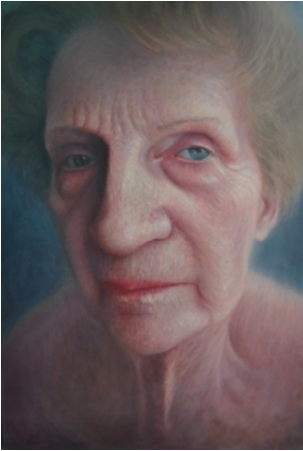
Lost time, 2010 olie/doek, 120 x 80 cm

2003 - -- Docente diverse instellingen On-going