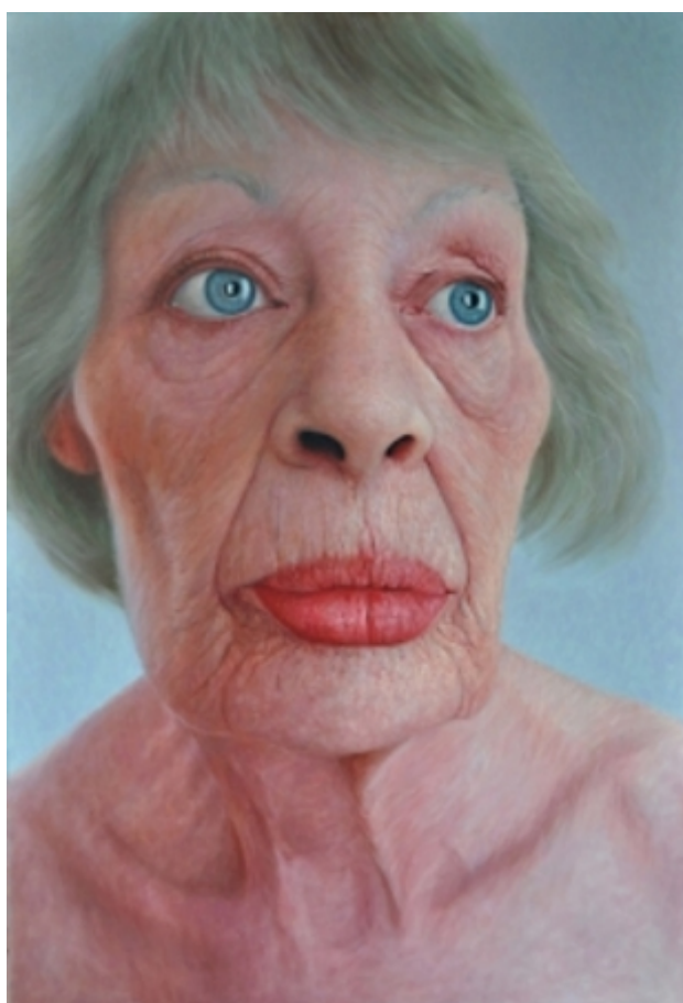
Blue eyed girl, 2009 olie/doek, 120 x 80 cm