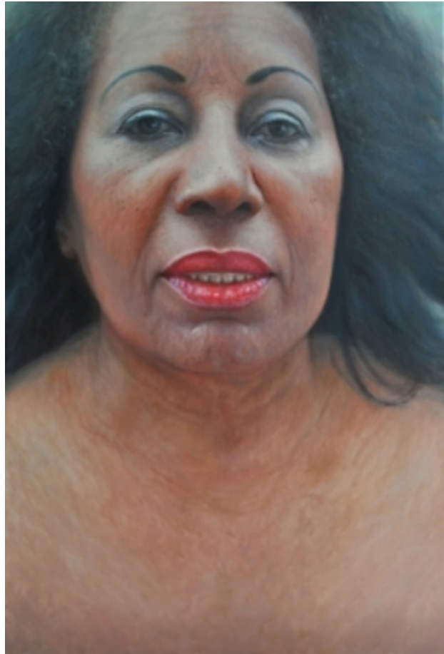
Behind the lines, 2010 olie/doek, 120 x 80 cm