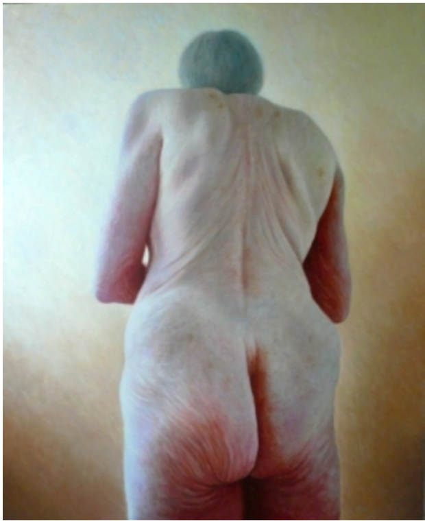
Fragil flesh, 2008 olie/doek, 120 x 100 cm