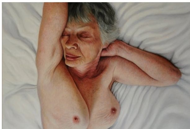
Dreamwoman, 2010 olie/doek, 120 x 80 cm