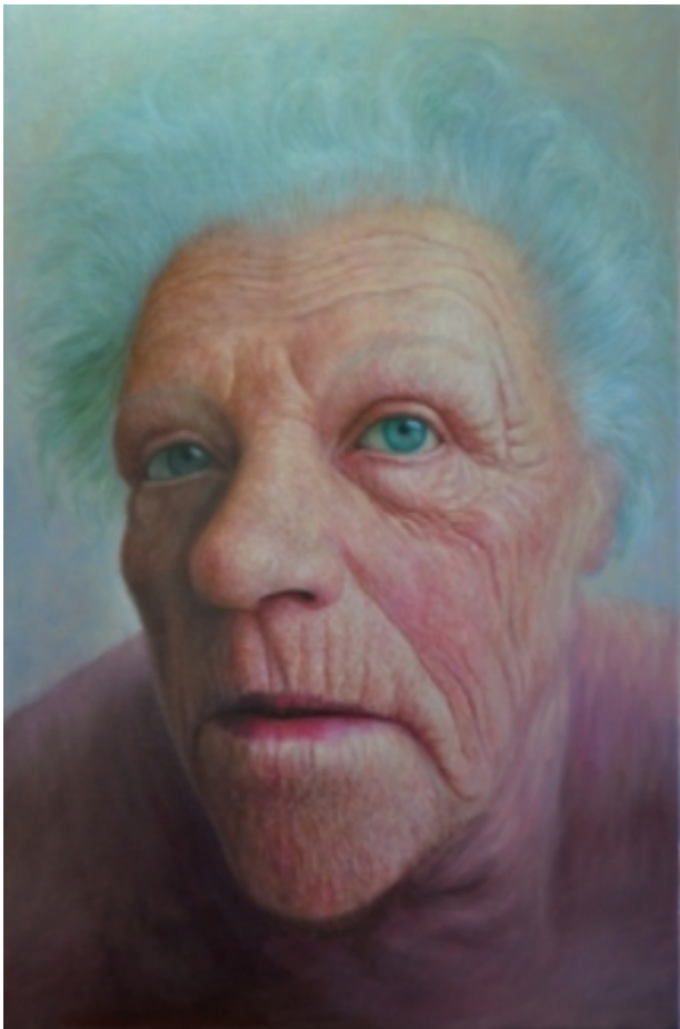
Marked, 2010 olie/doek, 120 x 80 cm