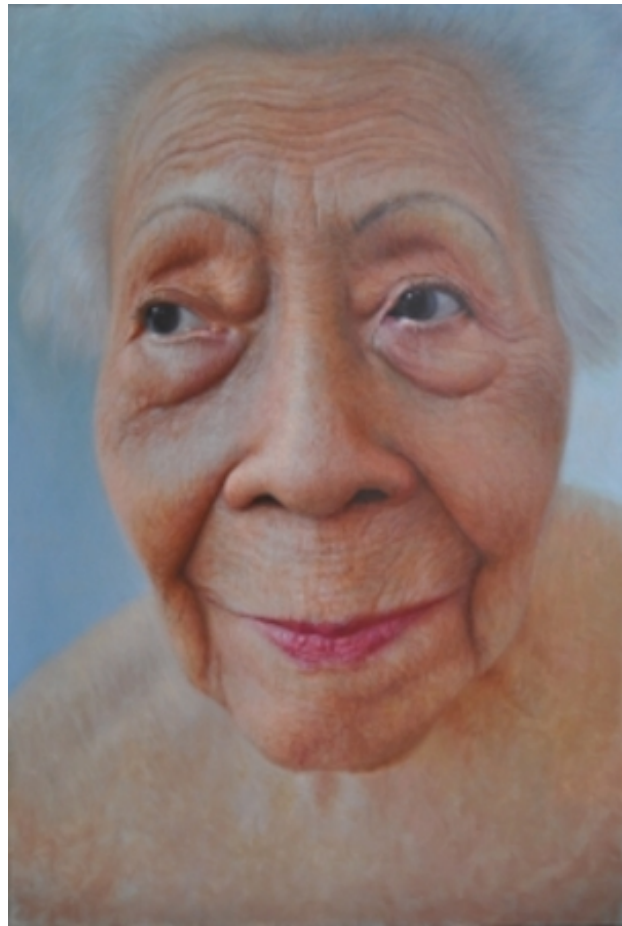
Wondering, 2010 olie/doek, 120 x 80 cm