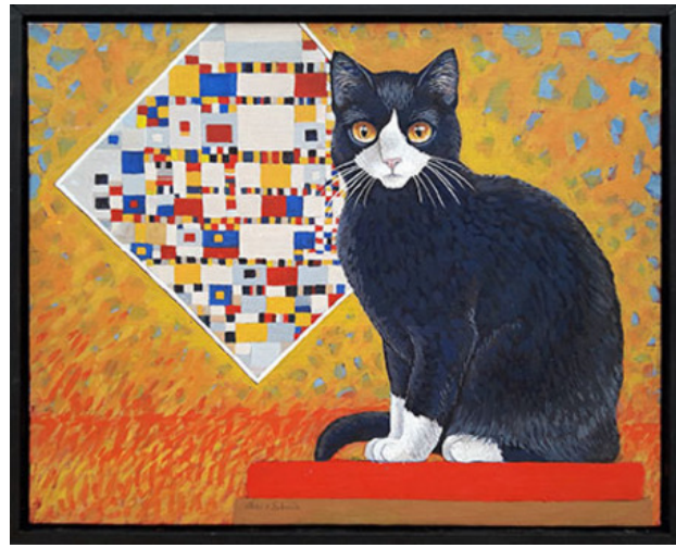
Boogie Woogie, 2018 eitempera, 24x30 cm