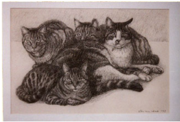
Vier Katten, 1997 Krijt, 30 x 45 cm