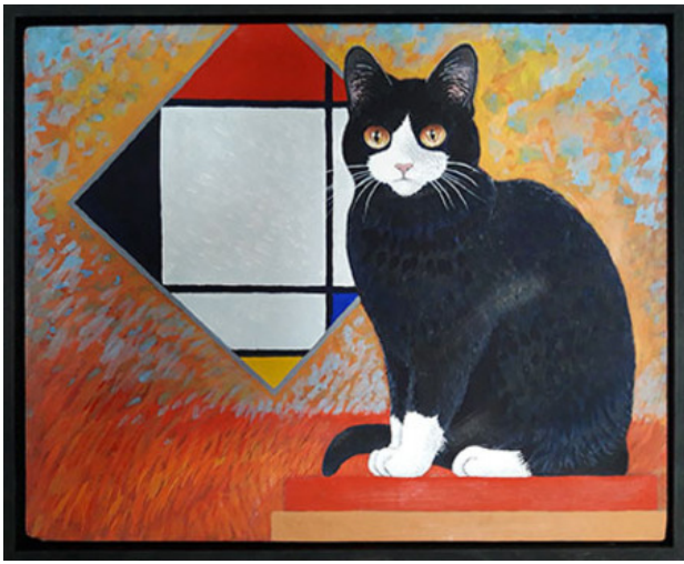
Mondriaan, 2018 eitempera, 24x30 cm