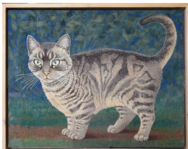
poes met map, 2019 eitempera, 24x30 cm