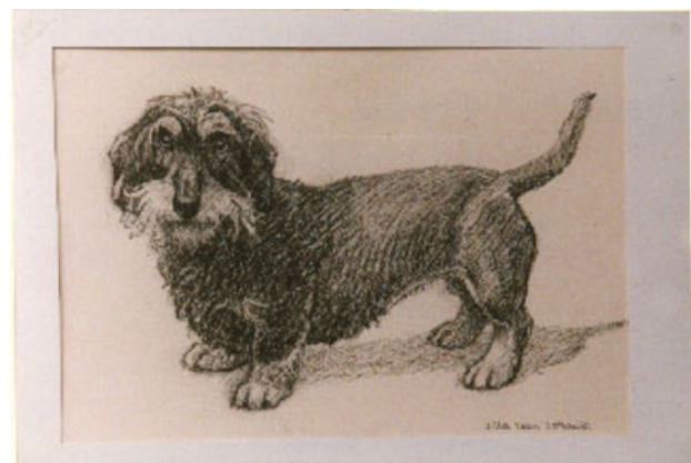
Hond, 1997 Krijt, 25 x 40 cm