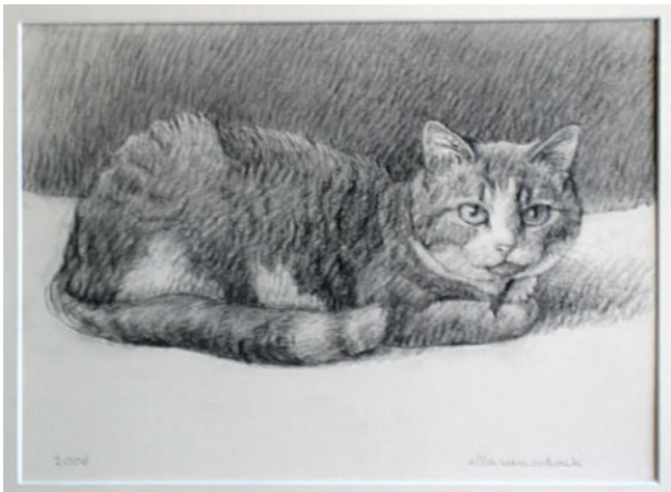
poes tekening, 30 x 45 cm