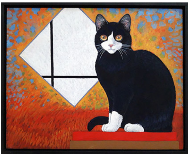
Mondriaan, 2018 eitempera, 24x30 cm