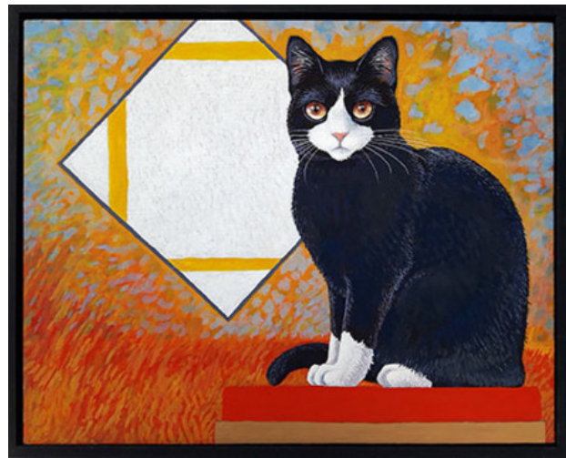
Mondriaan, 2018 eitempera, 24x30 cm