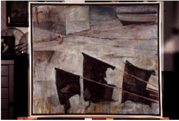
Op het strand van Etretat, 1997 olieverf, 70 x 60cm