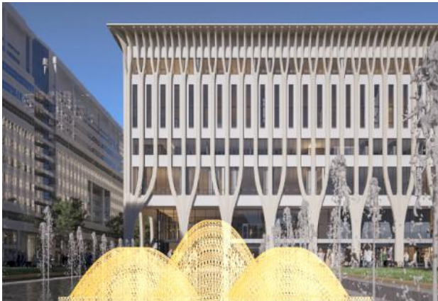
Kunstwerk Amare 1, 2025