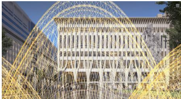
Kunstwerk Amare 3, 2025