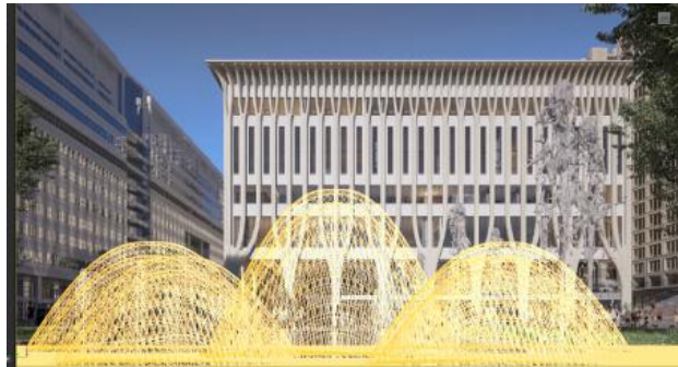
Kunstwerk Amare 2, 2025