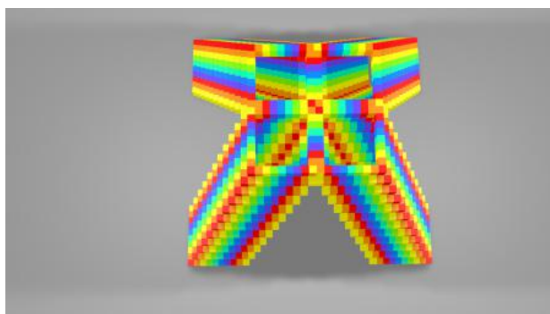
algo 2024, 2024