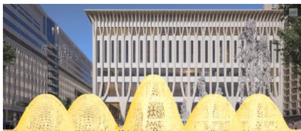
Kunstwerk Amare 5, 2025