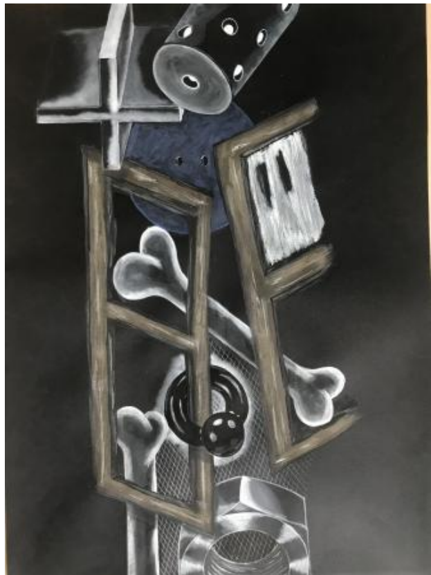
ANN DEIVIE 5, 2024 aquarel, 70x50