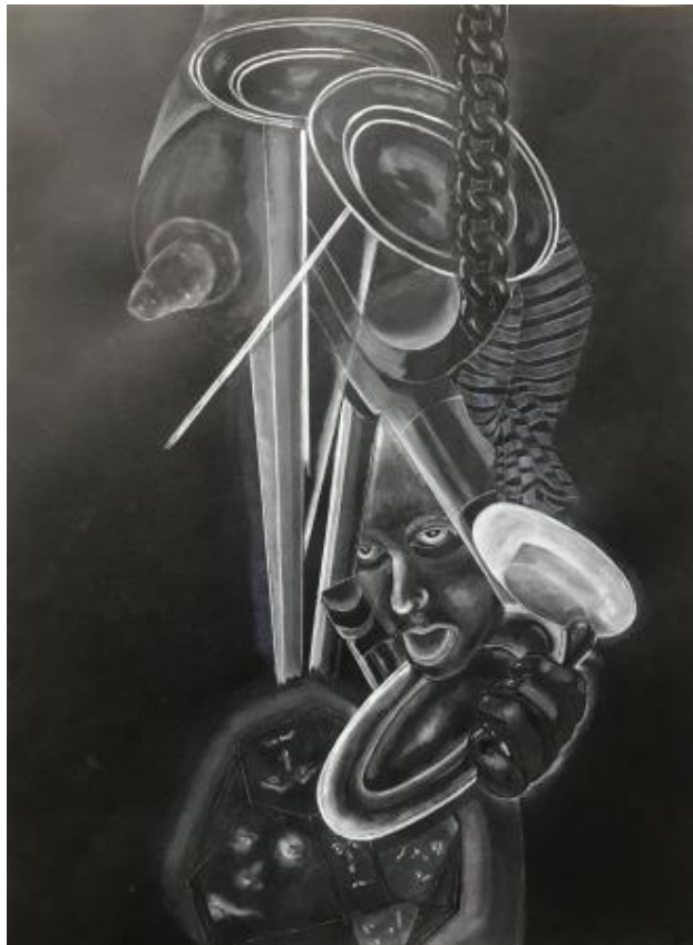
ANN DEIVIE, 2024 aquarel, 70x50