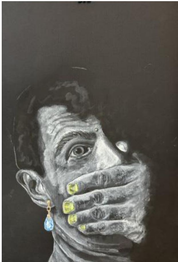
zwart werk, 2025 aquarel, 30x40 cm