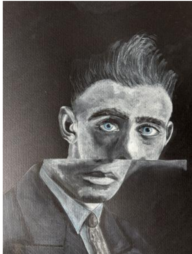
father son, 2025 aquarel, 30x 40