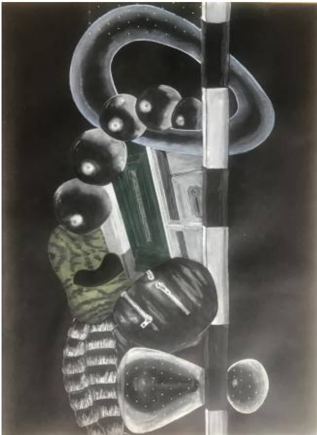
ANN DEIVIE, 2024 AQUAREL, 70x50