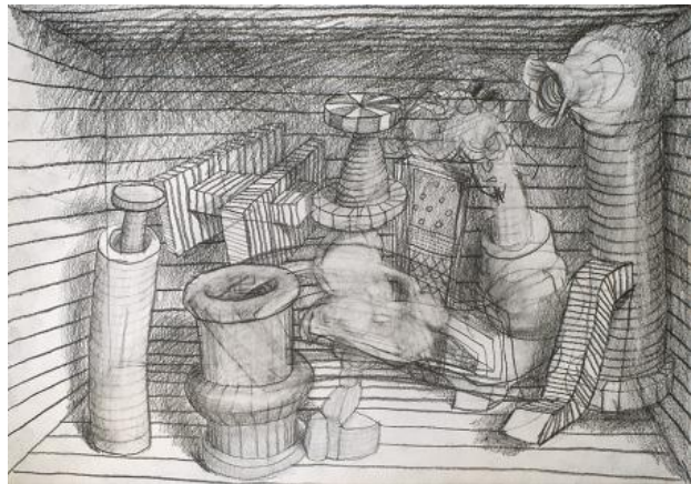
, 2021 pencil on paper, A3