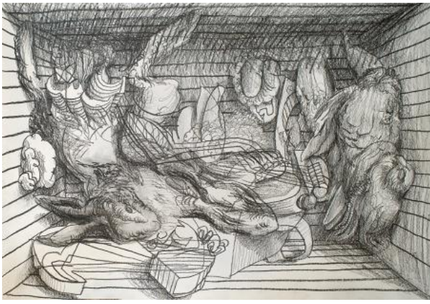
, 2021 pencil on paper, A3