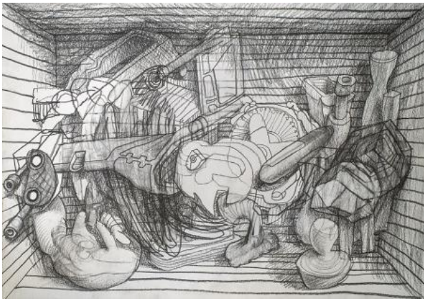
, 2021 pencil on paper, A3