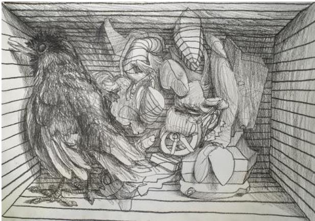
, 2021 pencil on paper, A3