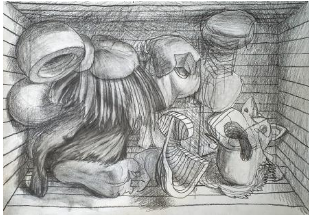
, 2021 pencil on paper, A3