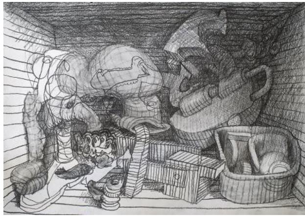
, 2021 pencil on paper, A3