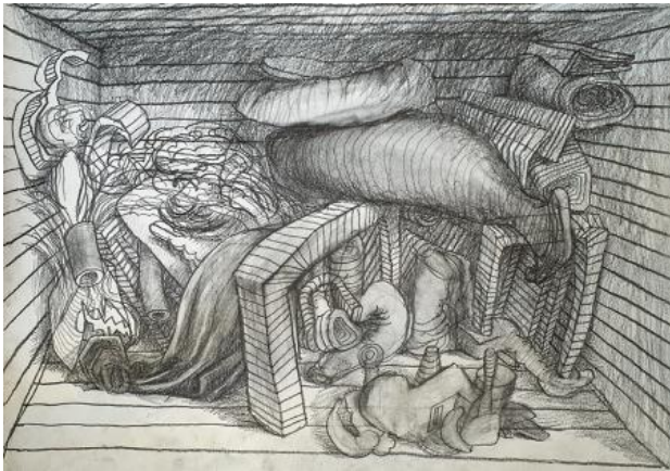
, 2021 pencil on paper, A3