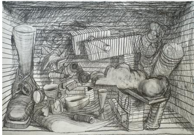
, 2021 pencil on paper, A3