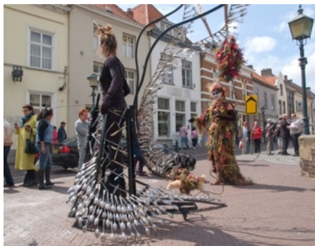
Vretusengel 'Bo", 2011 Diverse