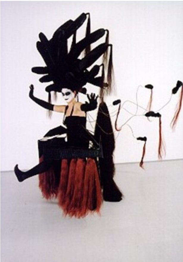
Totally shaved, 2001 Diverse, nvt