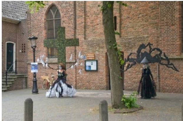
'Nietzsche', 2012 Diverse