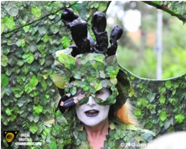
Ode aan de Boom, 2013 Diverse