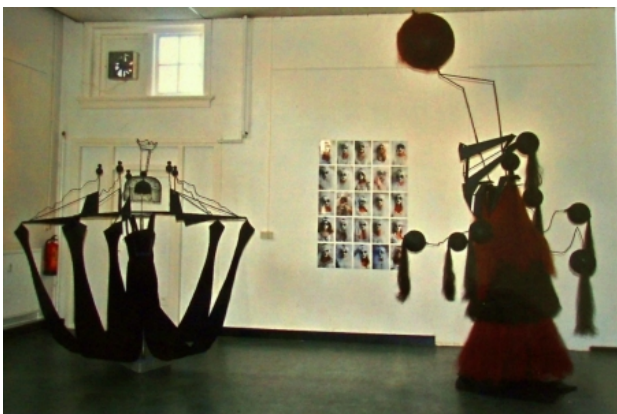
Etceteraetcetera., 2010 Diverse