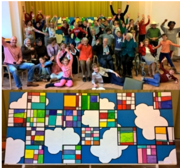
www.dekunstschool.com, 2015 Gemengd, 270x120