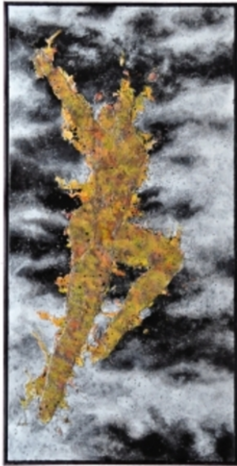
La Double Vita - High, 2013 Gemengd, 125x249x5 cm