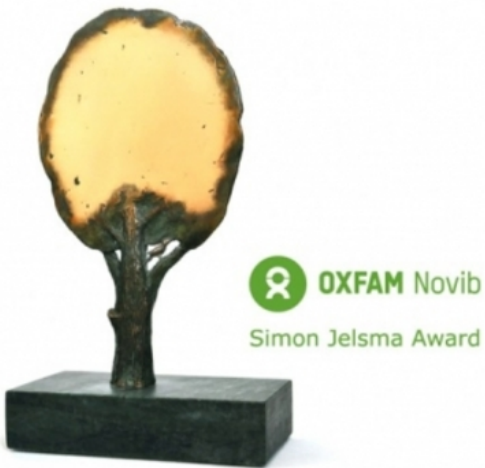
Oxfam Novib Simon Jelsma Award, 2014 Brons, 12x24x6 cm