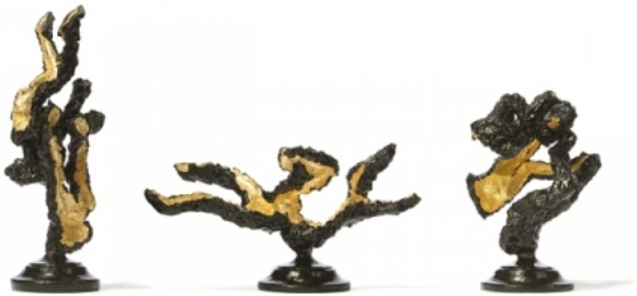
Soil of Ardour | Bright Dusk - Gold M1,2, 2013 Gemengd, p/s +/- 30x30x30 cm