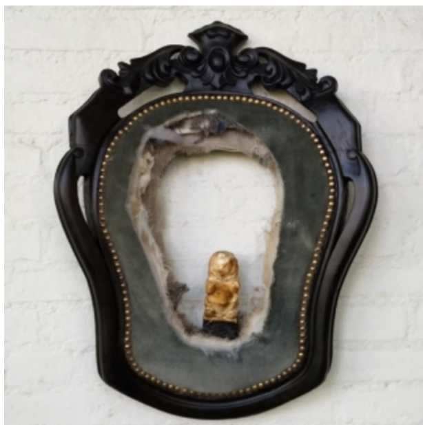
Sublimation of Perception | Coronate9, 2017 Gemengd, 40x60x8 cm