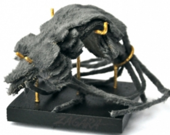
Cupidity, 2016 Gemengd, 7x7x7 cm