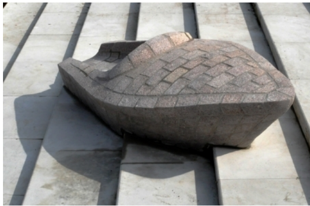
Speedboat Z414, 2014 Gemengd [Granito], 335x135x85