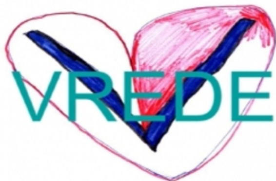
www.vredevanhetkind.nl, 2016 Gemengd, film