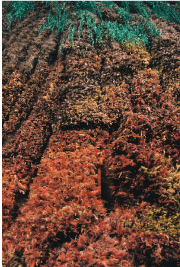
Oerboomstam, 2012 figuratief geweven, 205 x 305 cm