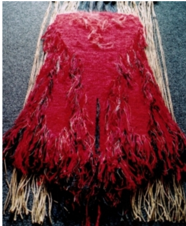
Vormweven, 2008 Linnenbinding en Ryaknoop