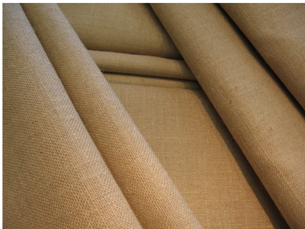
Eenvoud, 2019 Linnenbinding, 170 x 260 cm