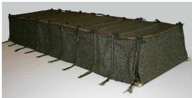
Corridor, 2018 Linnenbinding, 60 x 200