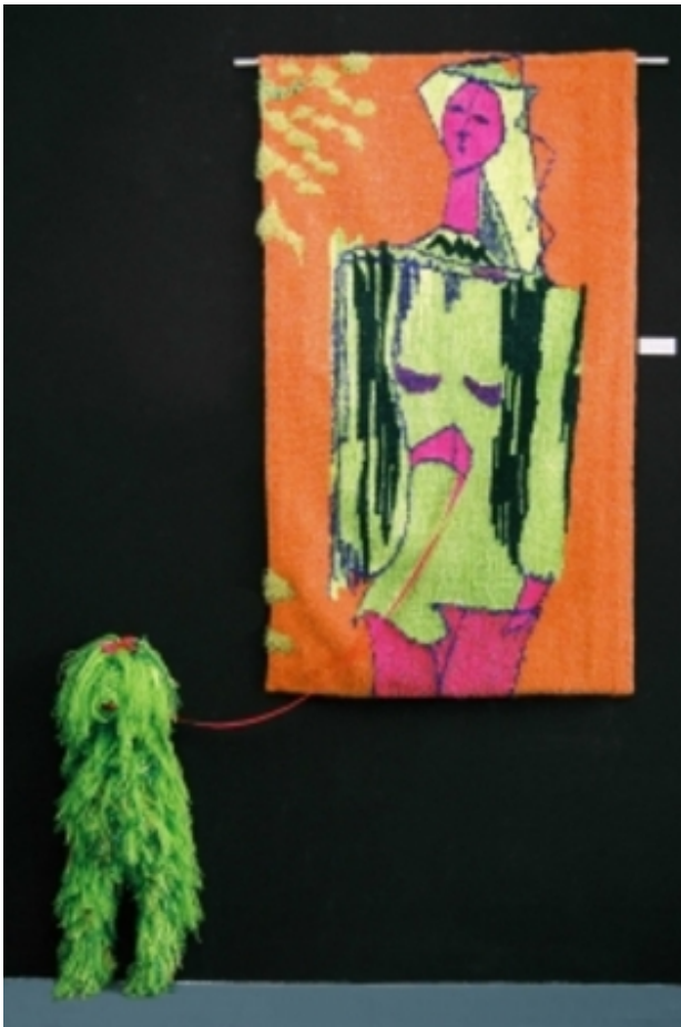
"Alter-ego", 2007 figuratief geweven, 80 x 130 cm