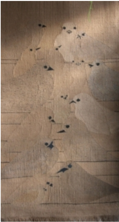
"Twitteren", 2011 Figuratief geweven van sisaltouw vervaar, 106 x 225