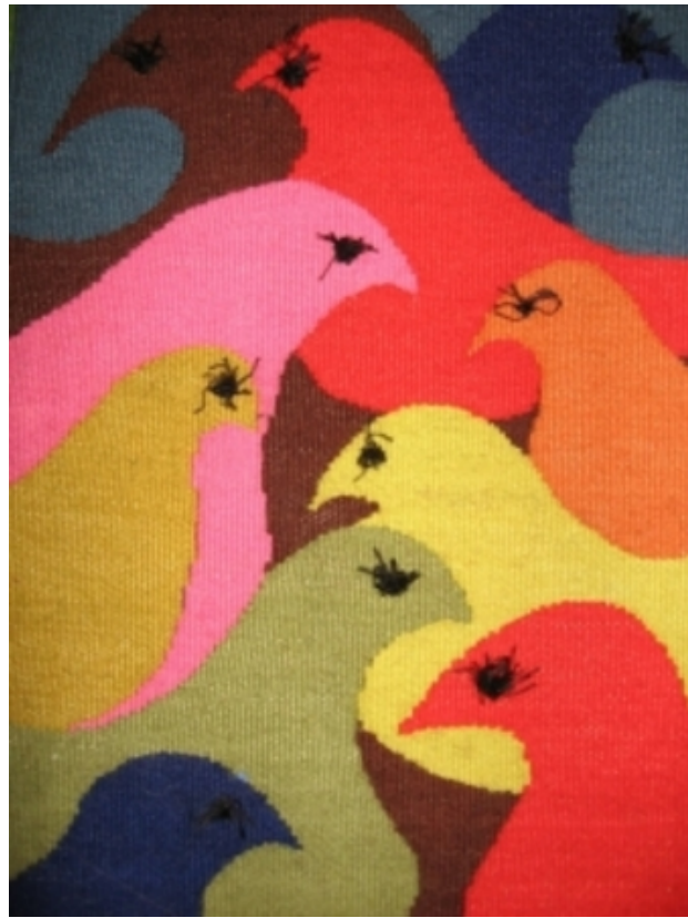
Birdwatching, 2009 Figuratief geweven, 120 x 150 cm