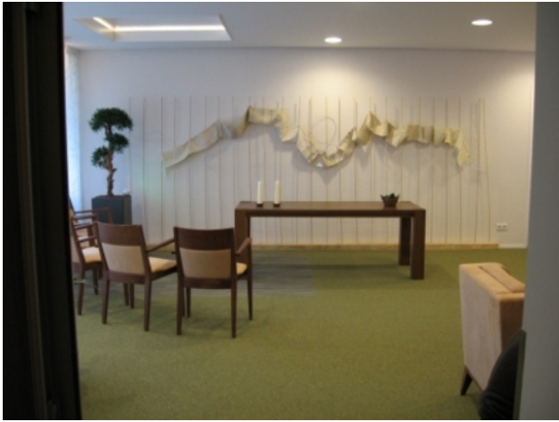
"De Levensweg", 2013 Handgeweven, 200 x 500