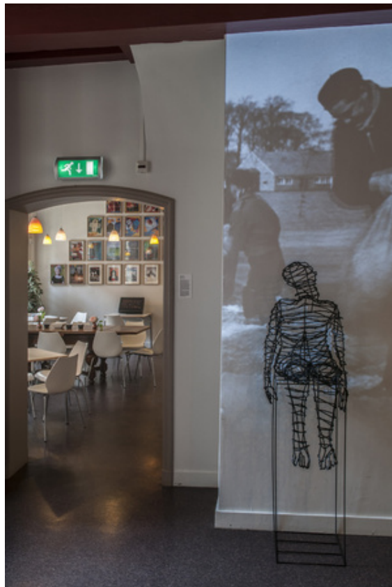
'Zittende Mens en de Man', 2018 Beeld en video, 185x50x65 en beeld van Polygoonjournaal februari 1953)