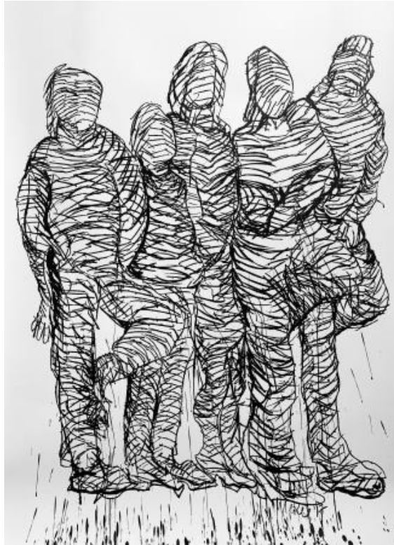
de Groep, 2018 Oost Indische Inkt met eigen inktrol-pen, 150 X 200 cm.