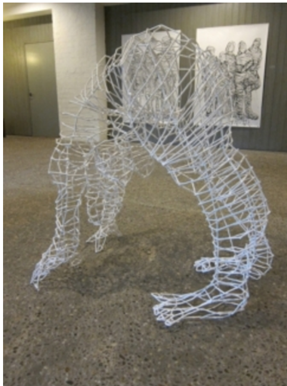
'Staande Vrouw', 2017 5 mm staal, afm.130x75x150