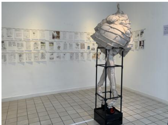
'Me and Boltanski on Teshima', 2025 Waterafstotende stof, blower 220V op rubber tegel, 12 mm. houten frame, kastje met MP-3 player met mijn hartslag, geluidsbox en mini-versterker. Dun houten frame en rubberen hart dat volblaast met een blower. Uit de speaker klinkt zacht mijn hartslag., (afm. 175 x 75 x 75 cm)