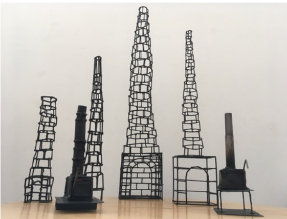
Schoorstenen, 2019 staal, Kleine Schoorsteen afm. 42x9x9 cm. / Dunne Schoorsteen 68x10x10 cm. / Dunne Schoorsteen met Stookhok afm. 86x17x14 cm. / Grote Schoorsteen met Stookhok afm.114x22x14 cm. / Rokende Schoorsteen 21x13,5x34 cm. / Rokende Schoorsteen op pootjes 18x13,5x36 cm.