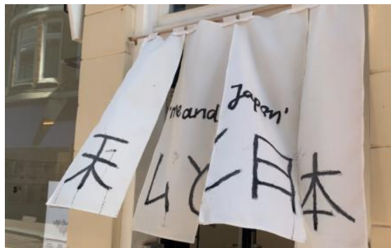
Me and Japan, 2025 Oost Indische inkt op doek, 80X90 cm