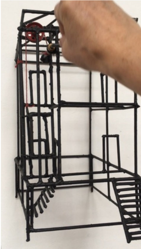
Huis met Lift, 2018