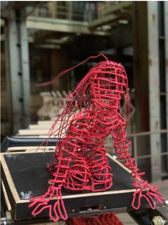
Vrouw op Hands en knieën en wapperende haren, 2020 5 mm staal met coating, 50x50x40

'Het universum is een ondeelbaar dynamisch geheel' (Einstein), 2024 Oost Indische Inkt met eigen inktrol-pen, afm.1.50 X 3,50