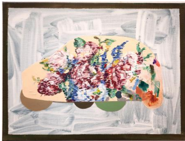
Met de beste bedoelingen, 2024 acrylverf op doek, 61x46cm.