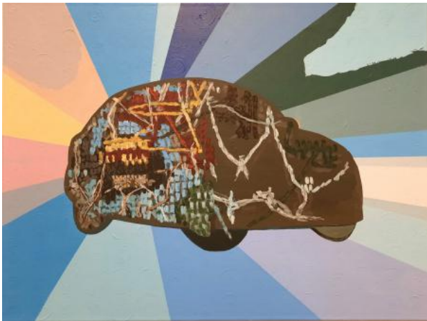
Kracht van betekenis, 2024 acrylverf op doek, 80x60 cm.