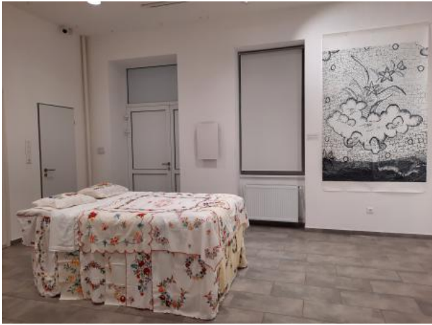
Overgeërfde Herinneringen - Örökölt emlékek, 2025 installatie - geborduurd linnen, 140x200x80cm